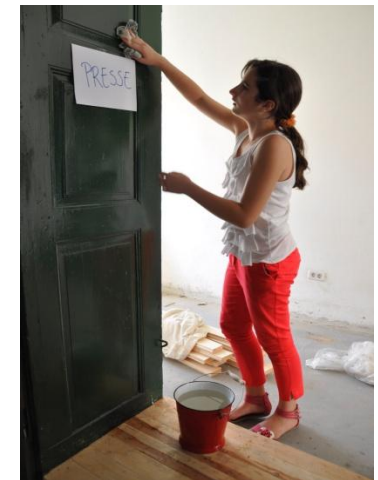
Teambesprechung und natürlich danach schön weiter putzen.