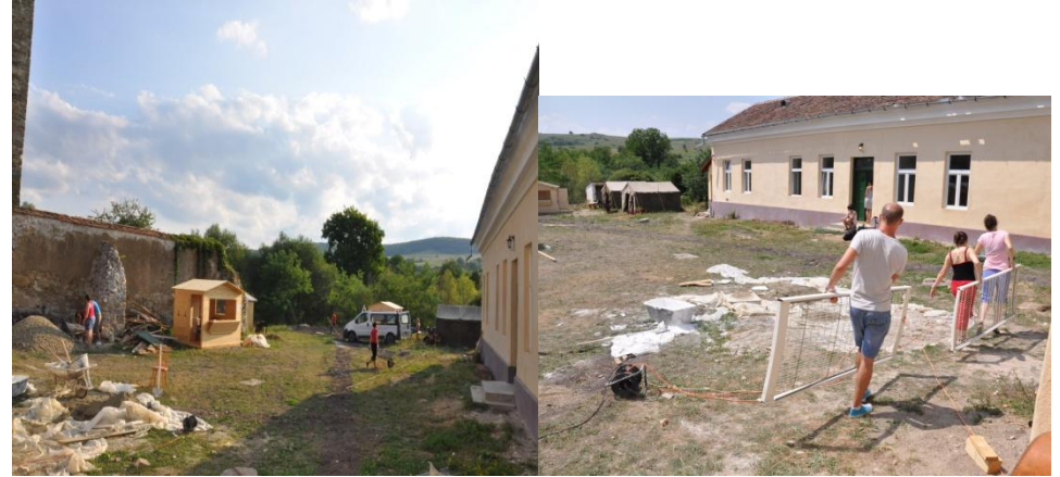
Schleppen, schleppen, schleppen...